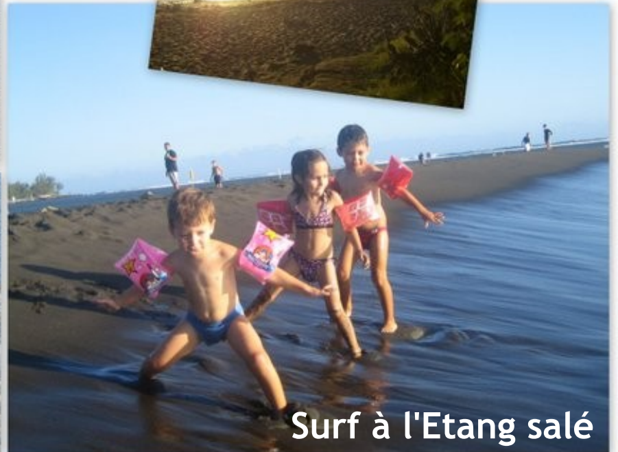
Surf à l'Etang salé