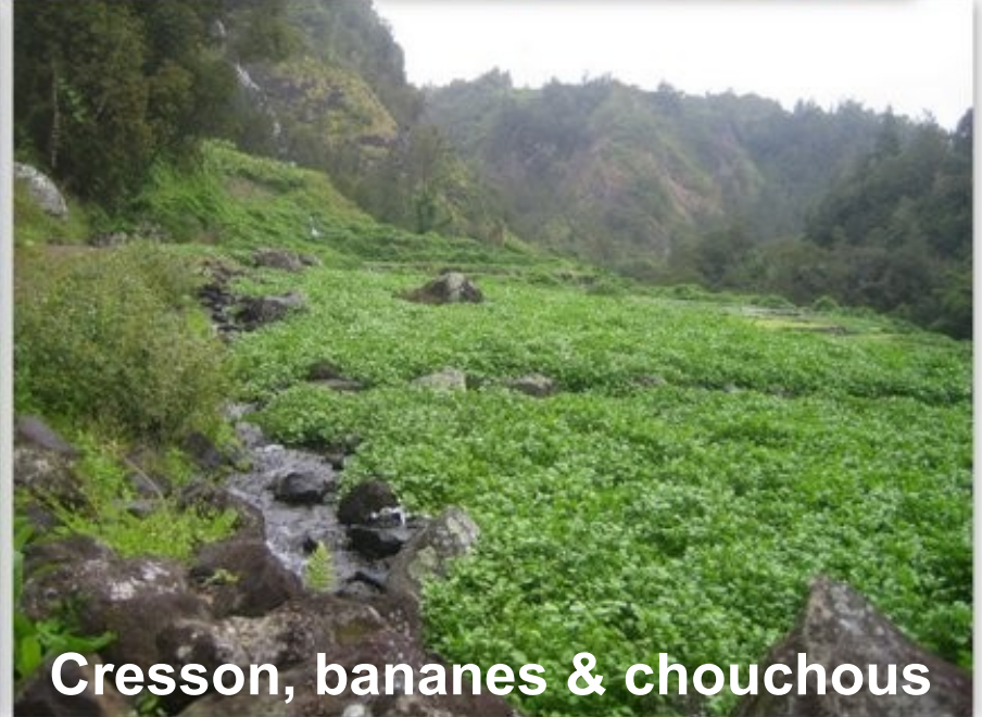
Cresson, bananes & chouchous