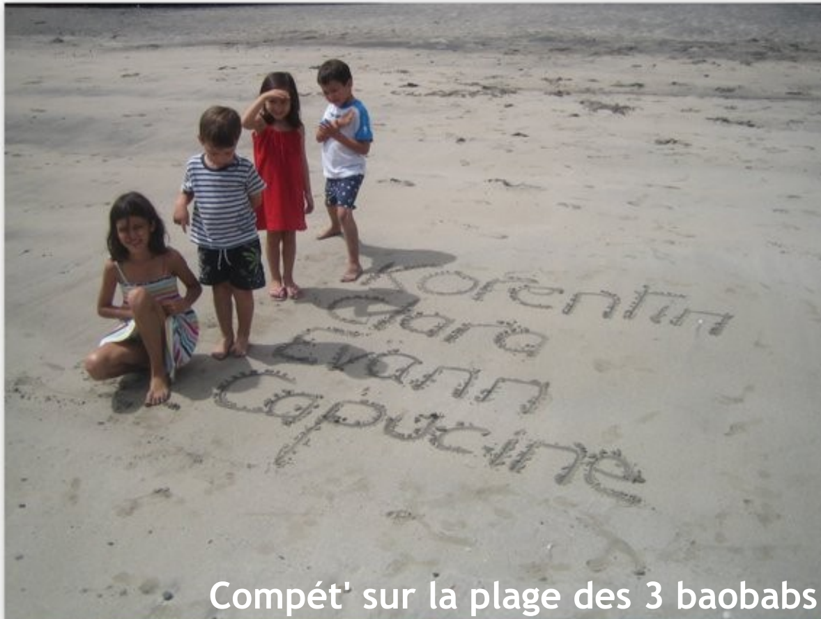
Compét' sur la plage des 3 baobabs