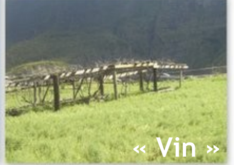
« Vin »